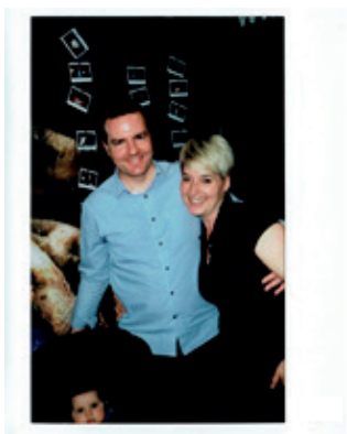
1. Preis – Ipad mini