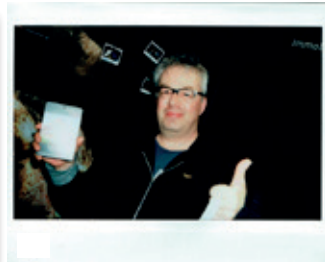
3. Preis – Gutschein Restaurant La Caletta in Muri